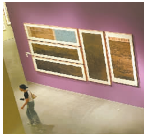
“宁波特展”共展出董源5幅山水画。

1997年，《溪岸图》在美国大都会博物馆展出，引起轰动。《纽约时报》不仅头版报道此事，还称此画为“中国的蒙娜丽莎”。不过学界一直对这幅画的真伪存在疑问。为此，1999年，大都会博物馆专门召开了一场关于《溪岸图》真伪的国际学术研讨会。普林斯顿大学教授方闻、耶鲁大学教授班宗华、中国鉴定大师谢稚柳均认可其为真迹，而加州大学柏克利分校的艺术史论家高居翰则认为它是“张大千最成功的伪作”。