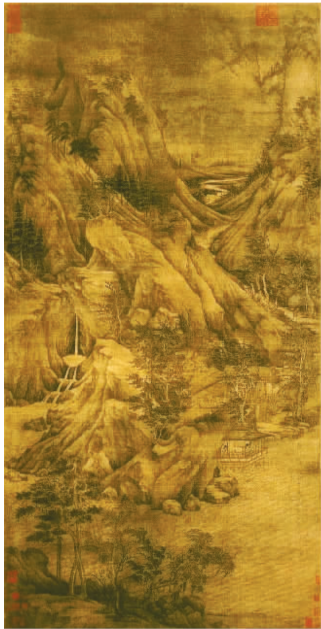
《溪岸图》原画现藏纽约大都会博物馆。

1992年杨蕙恩因病去世，年仅52岁。2013年，唐骝千与华裔考古学家、徐光启的后人徐心眉结婚。唐、杨、徐三人都醉心于中国艺术，加上财力雄厚，几十年间，他们收购了不少散落在世界各地的中国古代绘画。1997年，唐骝千在美国从著名收藏家王季迁手中买下了董源的传世名画《溪岸图》。2017年，将其捐赠给纽约大都会博物馆。