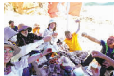
▲更重要的是,越来越多的人来到这里。这是象山县科技人才联合会的一场户外读书会,他们共同举杯,为亚运,也为一个更好的未来。