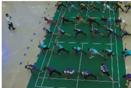
▲全民运动的氛围,也让这里变得更年轻,更有活力。