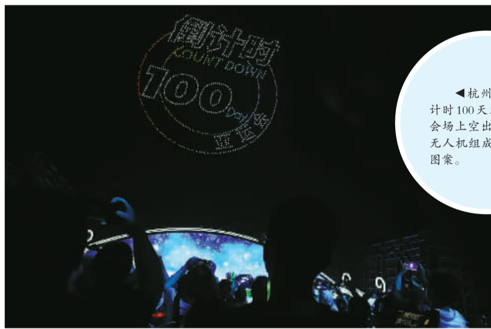
▲杭州亚运会倒计时100天文艺晚会,会场上空出现1000架无人机组成的字幕和图案。