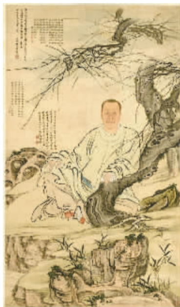
1676年禹之鼎绘《姜西溟画像》。

展览由宁波市文化广电旅游局指导,华茂艺术教育博物馆、天一阁博物院联合主办,将于9月23日正式对公众开放。届时,还将举行姜宸英专题研讨会。