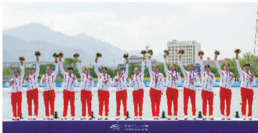
10月4日,中国队选手在颁奖仪式上。