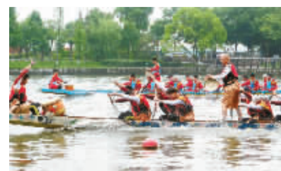
宁波龙舟竞渡。