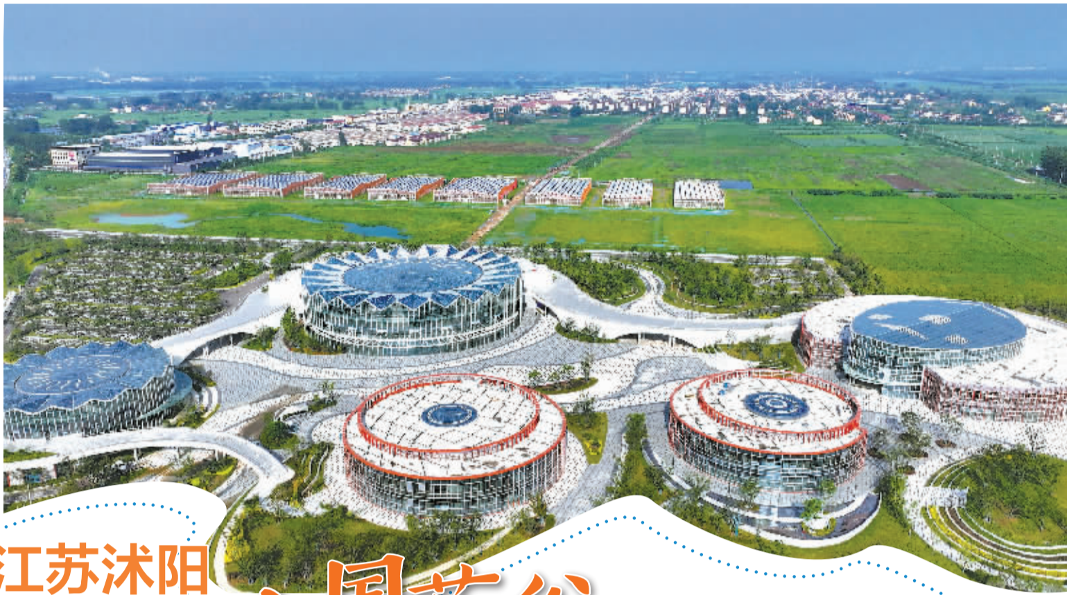
沭阳华东花木大世界是江苏省农业农村重大项目。