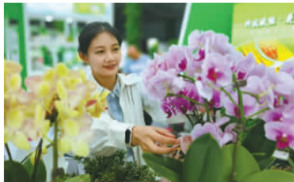
精美的花木盆景让人流连忘返。