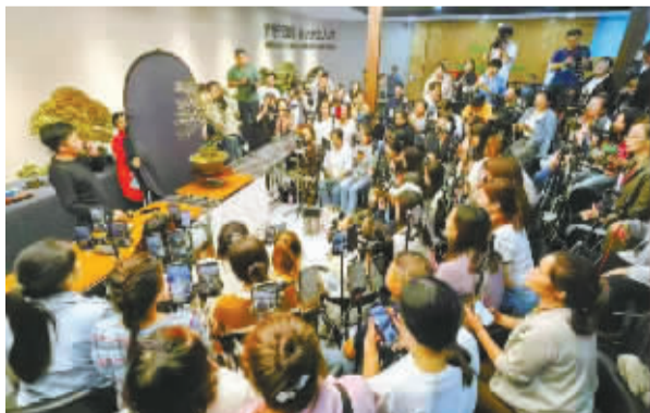
扎下艺森园盆景造型基地矩阵直播线上销售盆景。

备受瞩目的第十届沭阳花木节于9月27日至10月3日举办。本届花木节由中共沭阳县委、沭阳县人民政府主办，BCI中国区委员会、江苏省林木种苗管理站江苏省苗木商会承办。