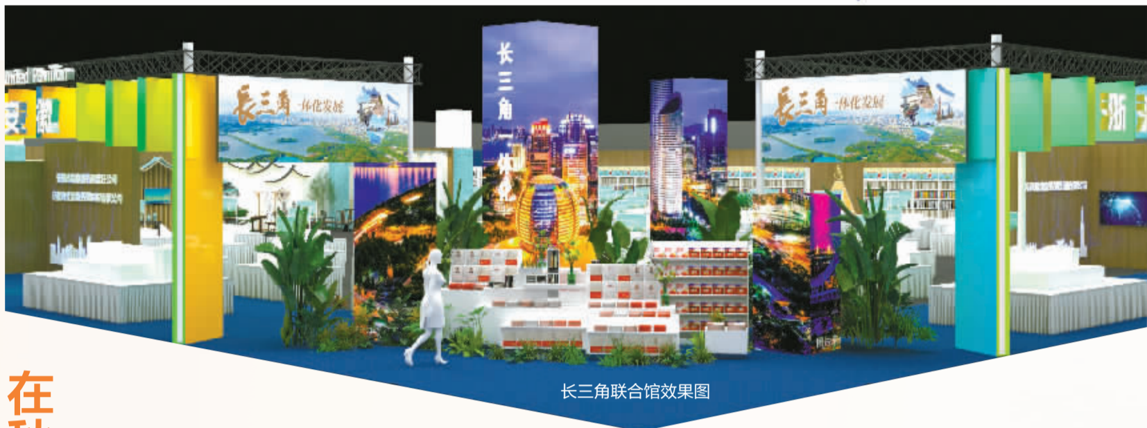
长三角联合馆效果图