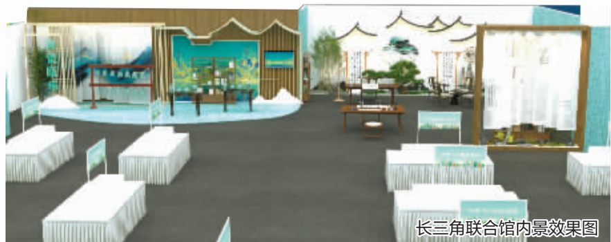
长三角联合馆内景效果图