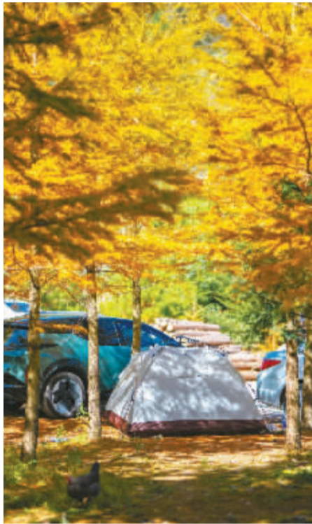
绵延的金钱松林,斑斓绚烂,灿烂若金。