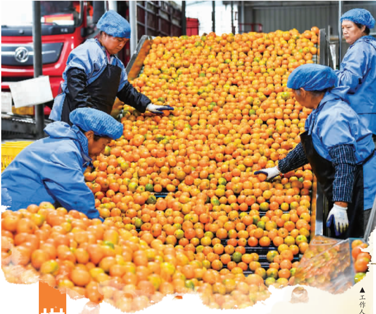
▲工作人员正在分拣柑橘。