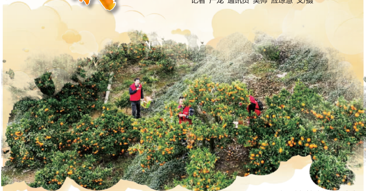
满山的柑橘树上硕果累累。