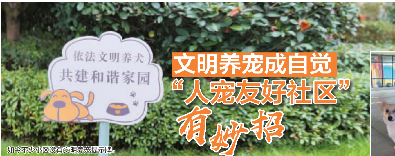
如今不少小区没有文明养宠提示牌。