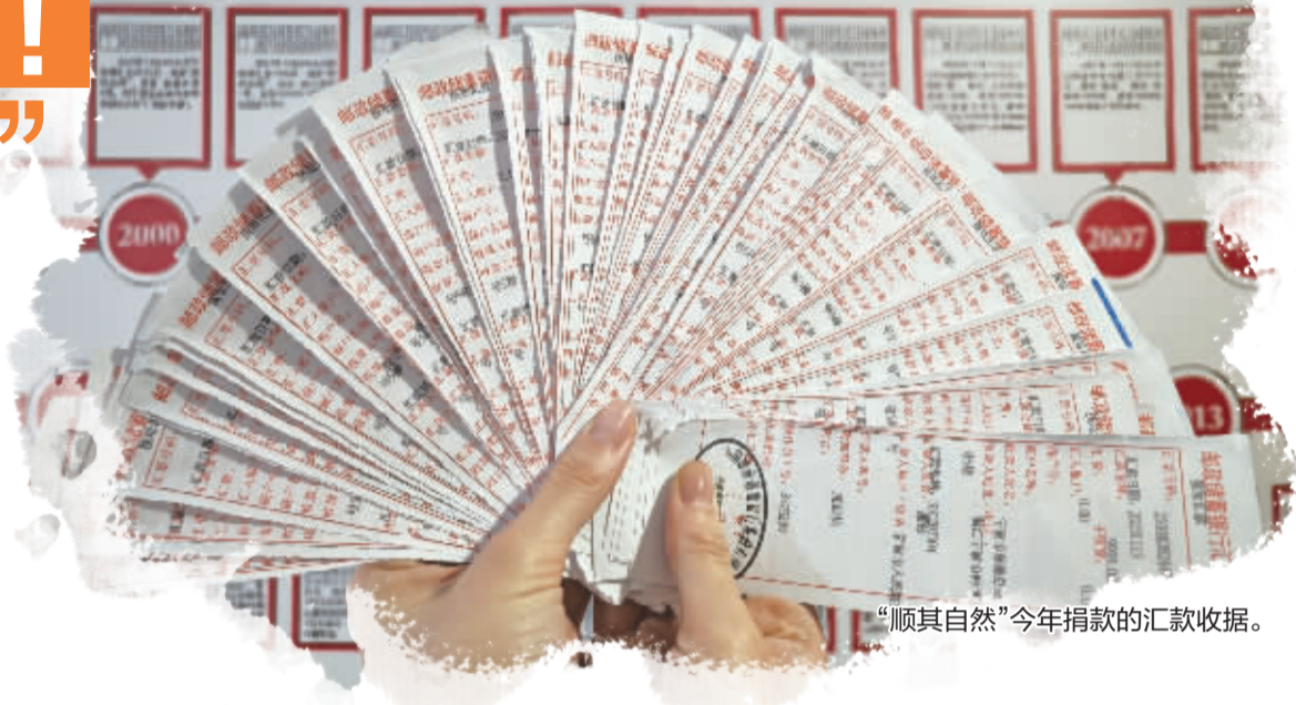
“顺其自然”今年捐款的汇款收据。