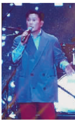
张韶涵、张信哲倾情献唱。