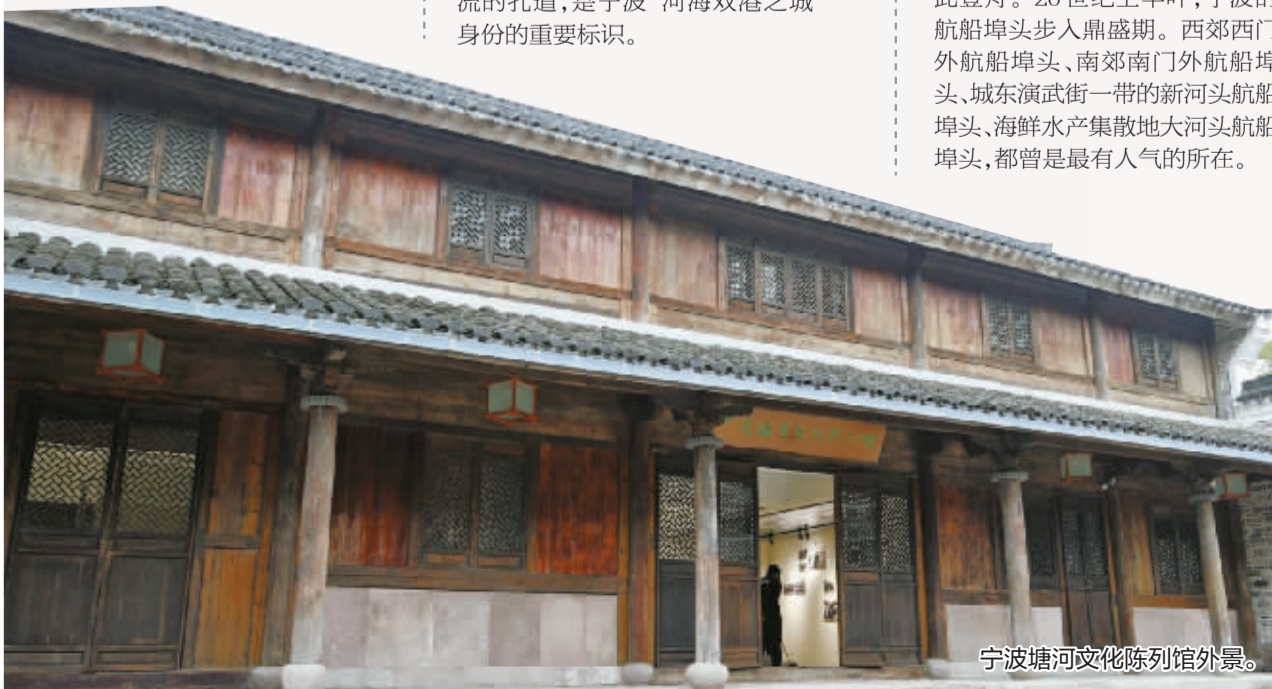
宁波塘河文化陈列馆外景。