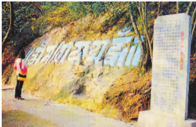
招宝山兰查体梵文摩崖石刻。图片来自《镇海县志(1994)》

◀50度陡坡上要覆盖30厘米左右厚的表土,是很困难的。除非人为或滑坡。 水银拍摄制图