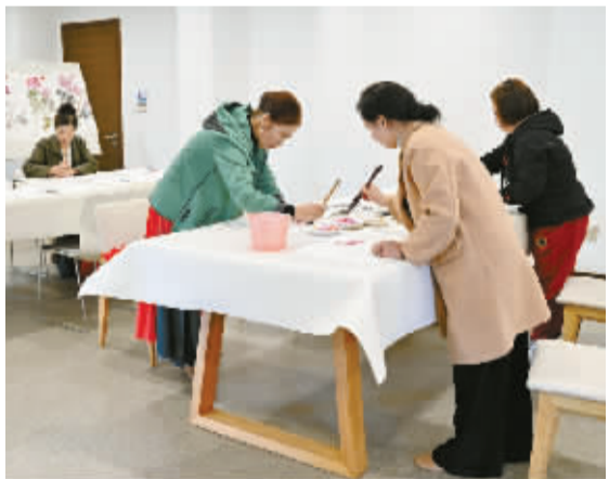
“长青乐园”里，员工家属正在学绘画。