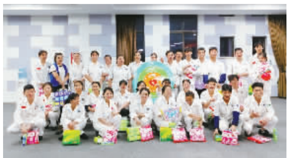
敏实集团的员工有丰富的业余生活。