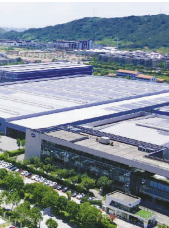
敏实集团北仑小港装配园区的员工宿舍大楼。