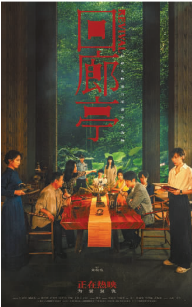
悬疑+爱情的《回廊亭》。