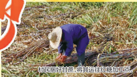
村民捆好甘蔗,将其运往红糖加工点。