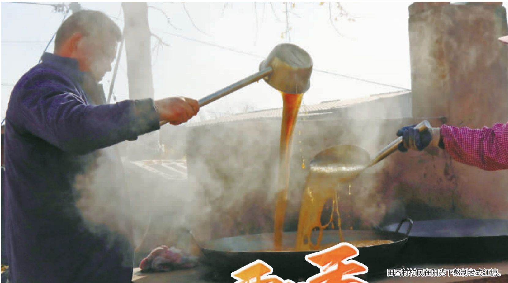
田岙村村民在阳光下熬制老式红糖。