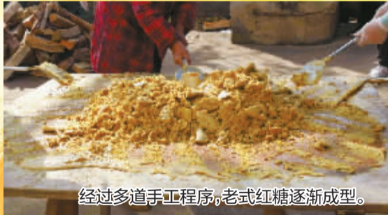
经过多道手工程序,老式红糖逐渐成型。