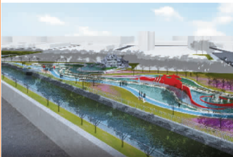
再生水公园效果图