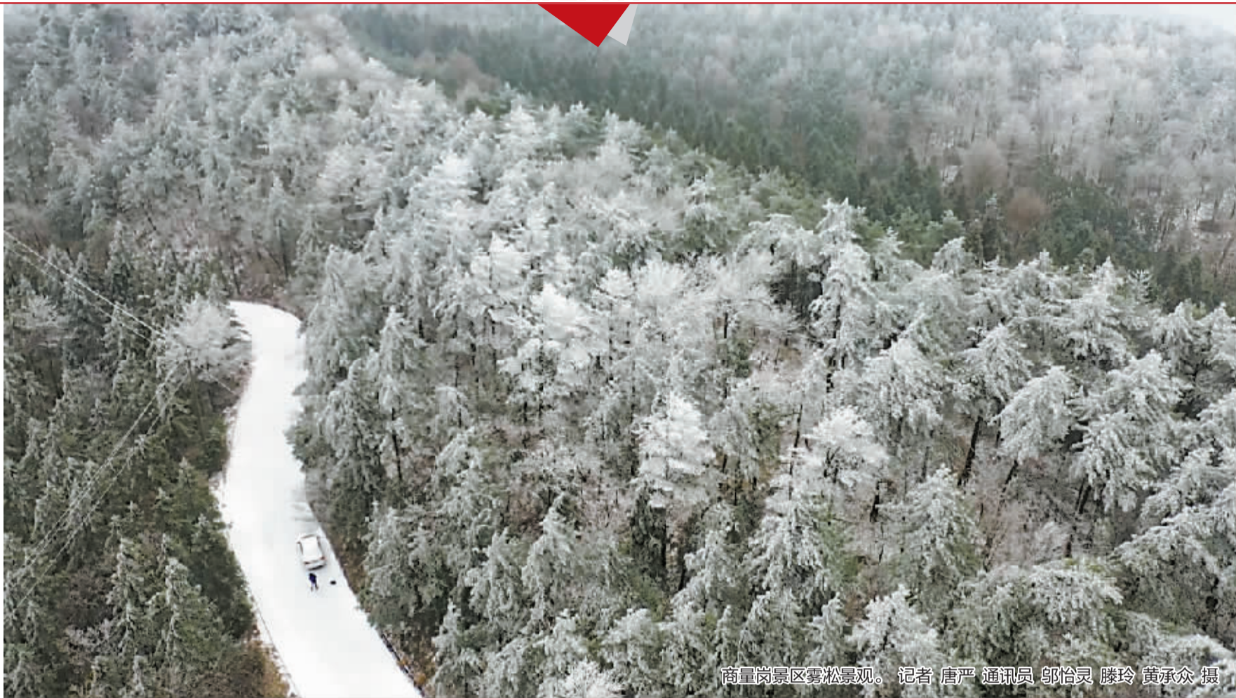
商量岗景区雾凇景观。