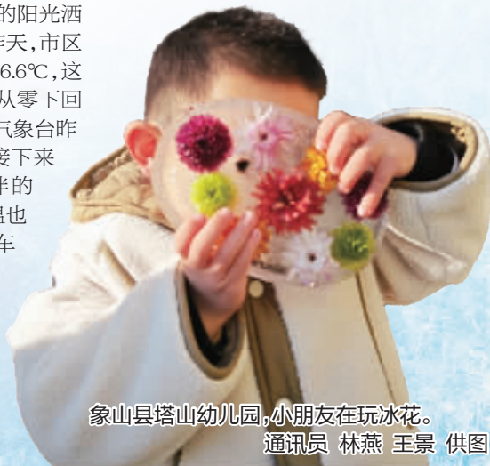
象山县塔山幼儿园,小朋友在玩冰花。