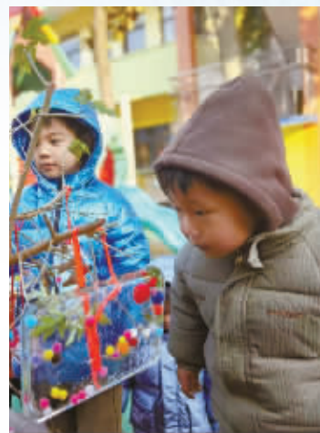
鄞州区五乡镇中心幼儿园南园,小朋友在赏冰花。