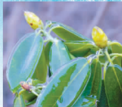
海曙区龙观乡,山间小路边,被冰封的云锦杜鹃呈现出勃勃生机。