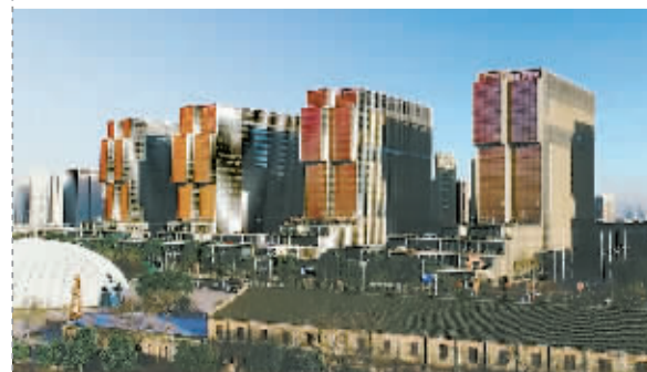
宁波留下了众多工业文化遗产,图为和丰创意广场。