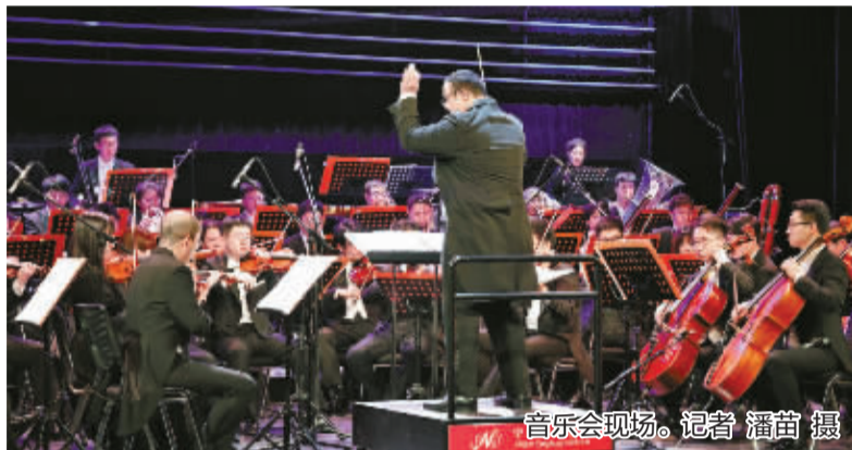
音乐会现场。

值得一提的是，参加本场音乐会的宁波八一合唱团，为海曙区文化馆直属群众艺术团队。该合唱团成立