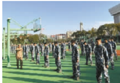
海航班学生正在体能训练。