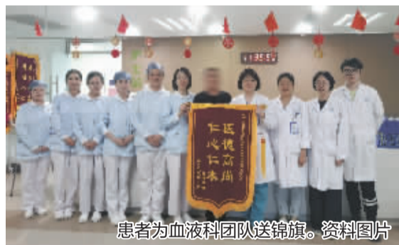
患者为血液科团队送锦旗。资料图片

因尿发黄、高烧不退、恶心呕吐等症状就医，结果被查出血栓性血小板减少性紫癜-溶血尿毒综合征(TTP-HUS)；原发中枢淋巴瘤经治疗后病情完全缓解，两年后淋巴瘤竟又在肾上腺复发；长期解泡沫尿来到医院诊治，完善相关检查后被确诊为多发性骨髓瘤，需做免疫化疗和自体造血干细胞移植巩固……如今，很多罕见、疑难、复杂、危急的血液病患者，都能在上海交通大学医学院附属仁济医院宁波医院（宁波市杭州湾医院）血液科得到精准诊治，重启精彩人生。