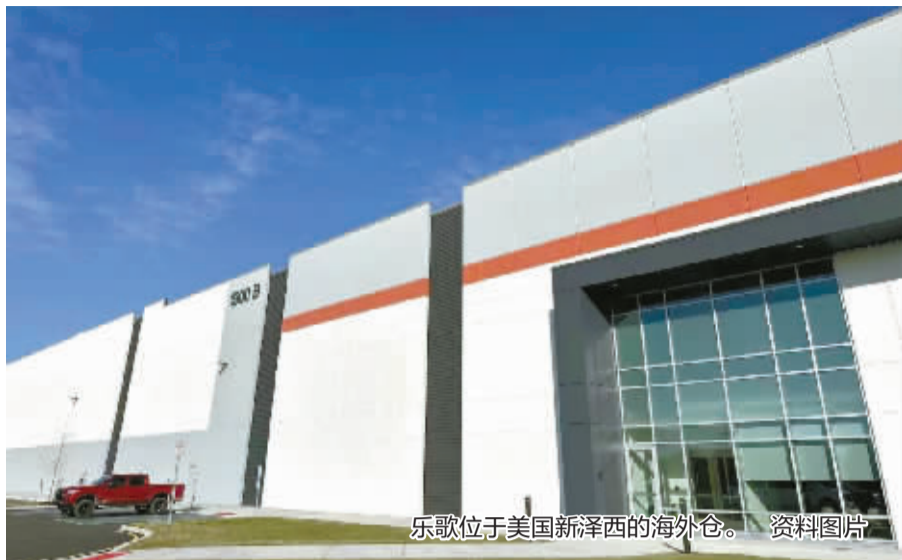
乐歌位于美国新泽西的海外仓。资料图片

跨国公司是参与全球化的重要主体。当前，浙江省实施“地瓜经济”提能升级“一号开放工程”，一大批宁波民营企业正在响应号召，从国际贸易走向跨国经营。