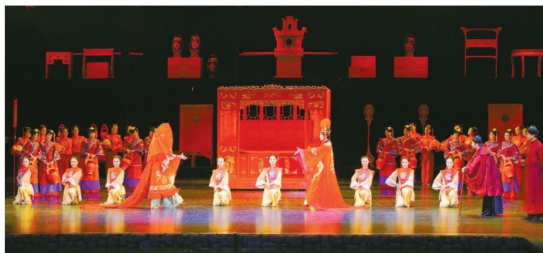
舞剧《十里红妆·女儿梦》剧照。

今年政府工作报告提及,2024年宁波将“实施文艺创作攀峰计划,打造一批原创文艺精品力作”。“攀峰”如何解读,本土文艺创作该如何“破圈”?话题引发代表委员的热议。