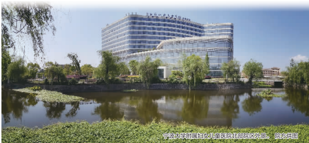
宁波大学附属妇女儿童医院北部院区外景。

2014年底,小儿肾病专科建制搬至北院;2015年,小儿泌尿外科也建制搬至北院,并开放床位47张,共同组建小儿泌尿肾病中心。同年,作为宁波市医疗卫生品牌学科的生殖医学中心工程项目,获得市发改委立项,随后生殖医学中心楼在北部院区开工建设,成为华东地区一流的区域性生殖医学中心。