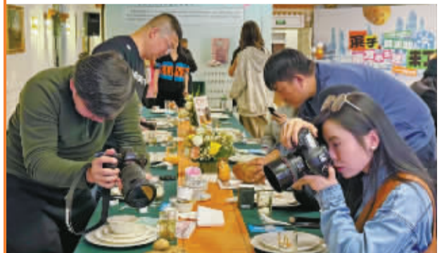
南方小土豆引起了哈尔滨市民的极大兴趣。