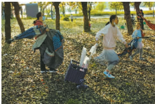
她是生动的烟火,也是具体的生活。