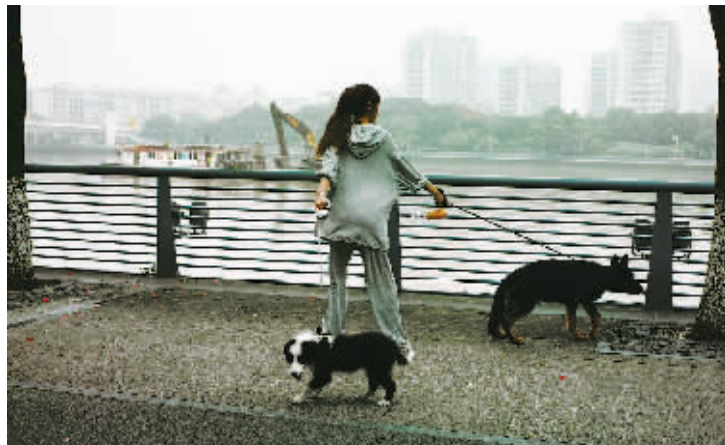
有时收获,有时失落,生活就如潮起潮落,要活得洒脱。