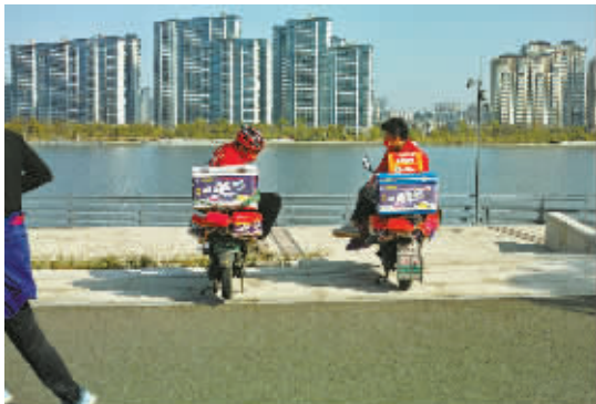
有时代留下丰富细节,也有融入日常的亲切。