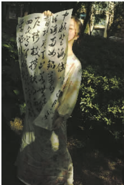
这里有拖家带口、呼朋唤友的聚会,也有一个人的陶醉。