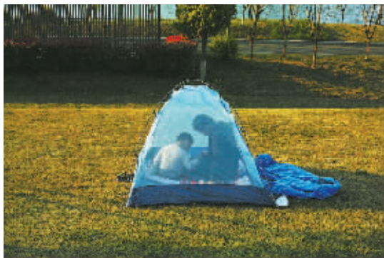
是江河无限,也是自在空间。