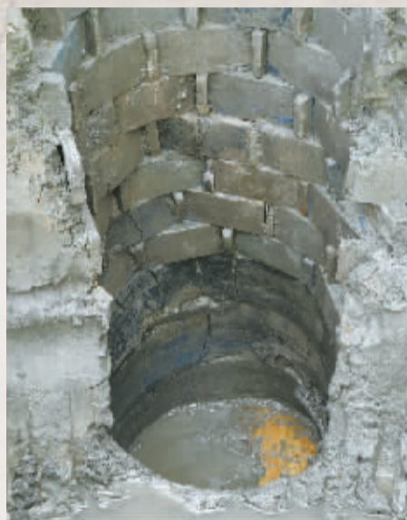
余姚杜义弄汉六朝遗址发现的水井。