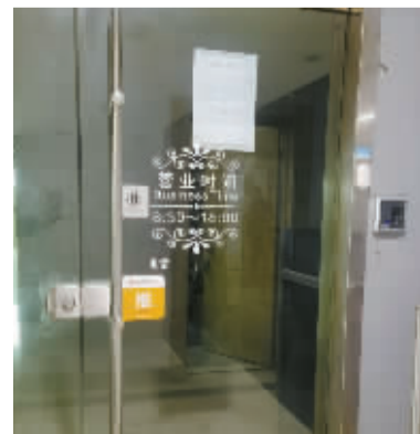
该店玻璃门上还贴着一张招租告示。