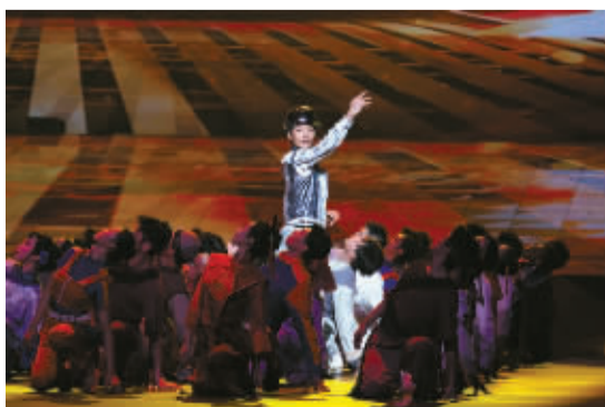
文艺精品集锦《一路芳华》