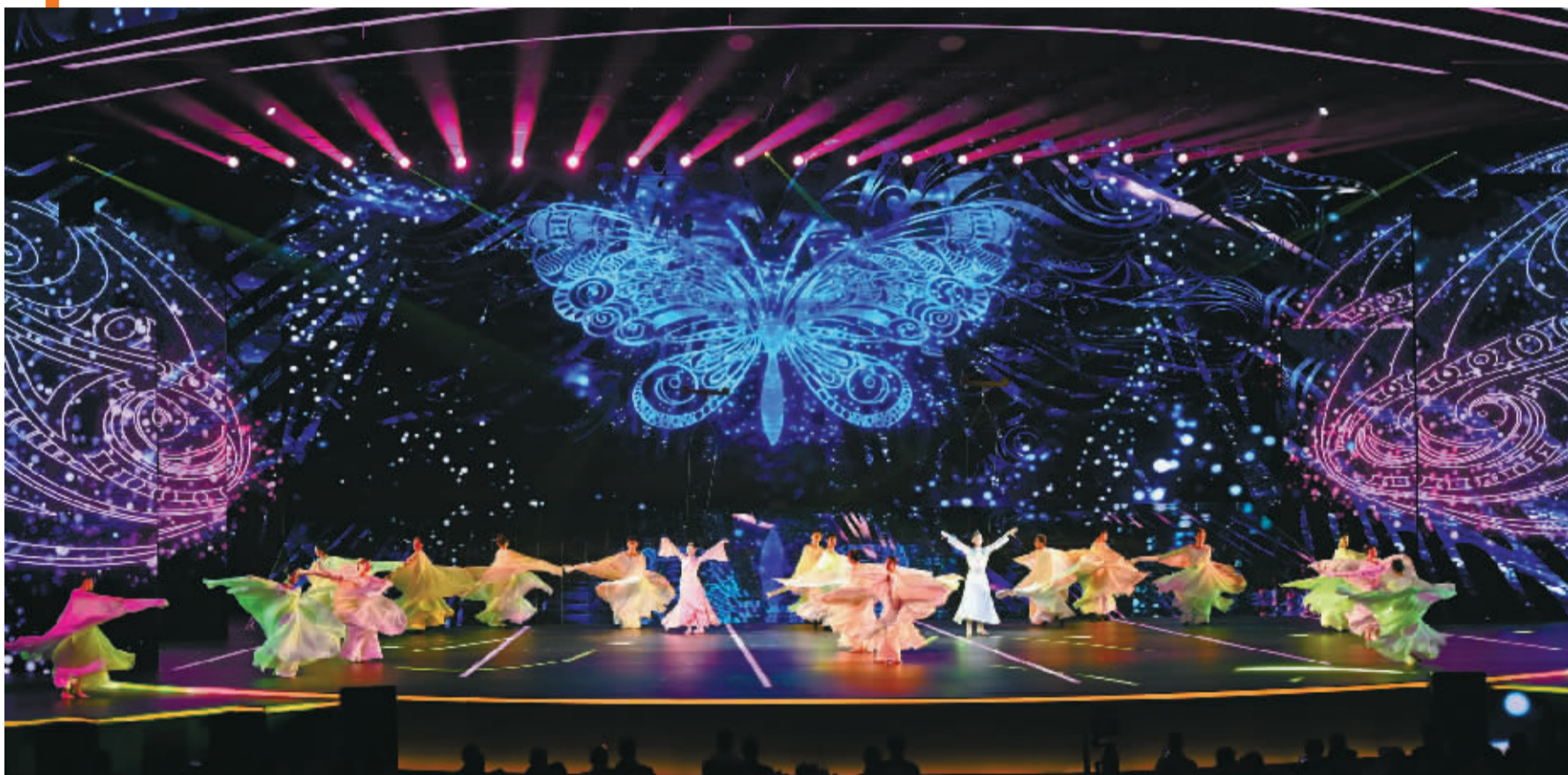
创意舞蹈《梁祝·蝶恋花》