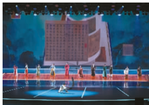
情景舞蹈《盛世修典遐想》