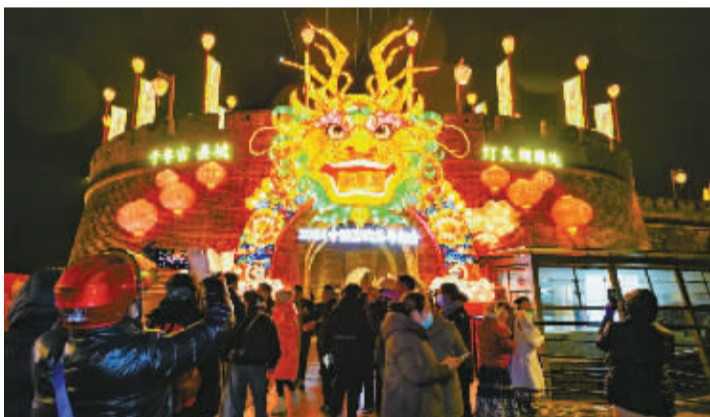
慈城灯会上的龙，让新年的期待变得更隆重。