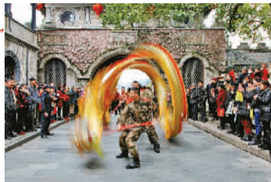
奉化溪口的龙，舞出了非遗的气势和厚重。