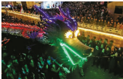
宁海长街的龙，每年正月十八点亮夜空。