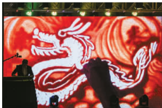
乡村文化礼堂“村晚”上的龙，映照全村老少的笑容。