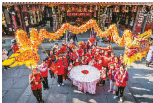
每个人心里的龙，激励着繁忙的城，贯穿着家国的梦，见证着又一年，风雨兼程，山河与共。