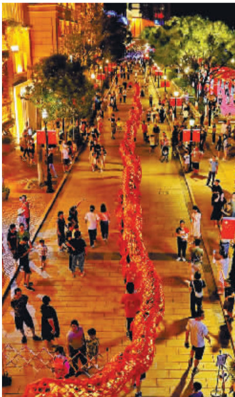
江北老外滩的龙，迎着三江口徐徐而来的风。韩良根 摄