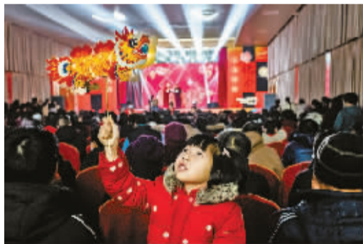
孩子高高举着的龙，会一直留在童年的梦中。