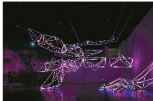
宁波美术馆的龙，科技感艺术感爆棚。