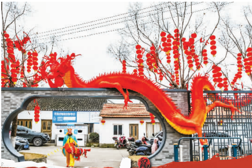
北仑柴桥的龙，憨态可掬鲜活灵动。