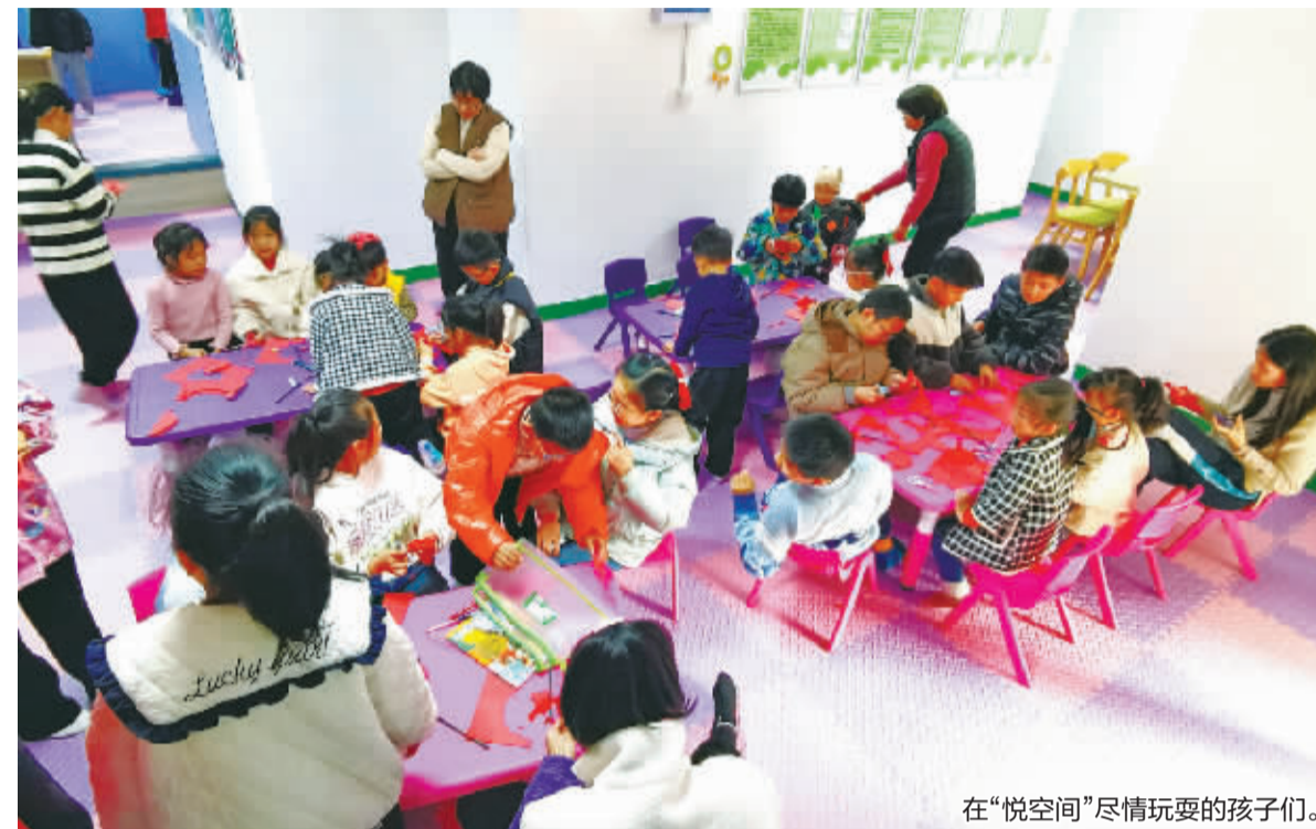
在“悦空间”尽情玩耍的孩子们。

2月18日上午,鄞州区姜山镇狮山社区香悦花苑小区190平方米的“悦空间”正式亮相,大家或参加剪纸,或打台球,或杀一盘象棋,不同年龄的居民都能在这里找到乐趣。