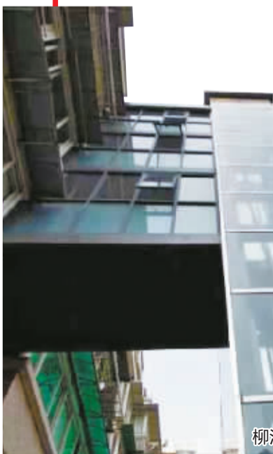
柳汀春晓小区的第一部加装电梯。