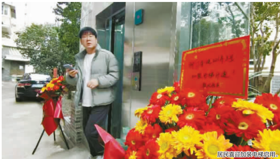
居民喜迎加装电梯启用。