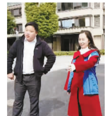
网格员在小区内巡查。