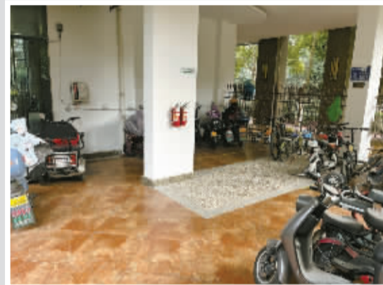
紫郡小区,多数架空层内都装有充电桩。