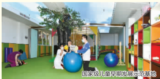
国家级儿童早期发展示范基地