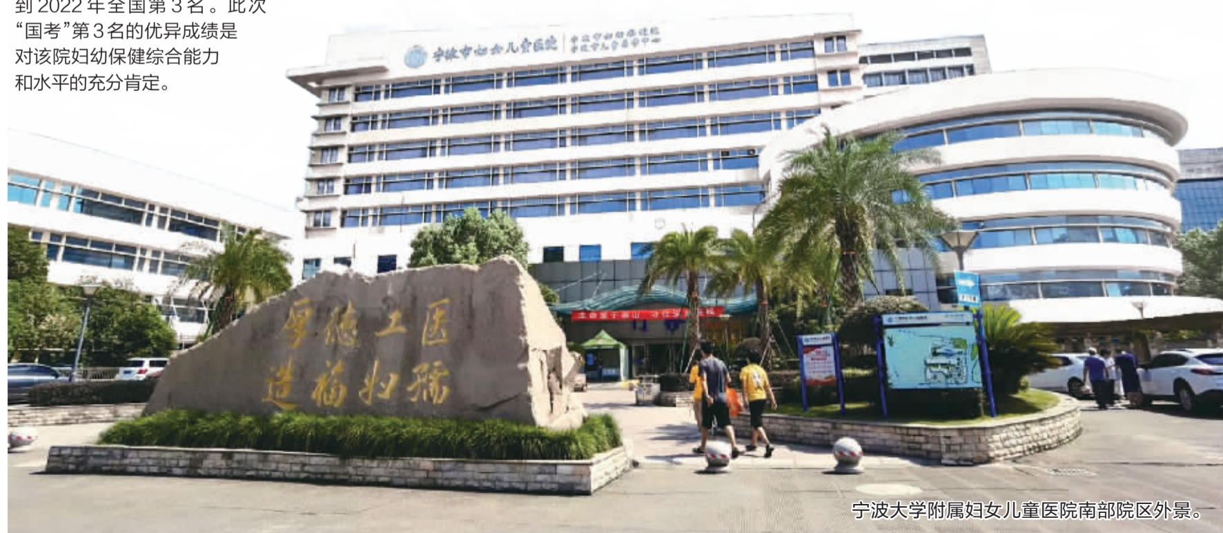
宁波大学附属妇女儿童医院南部院区外景。