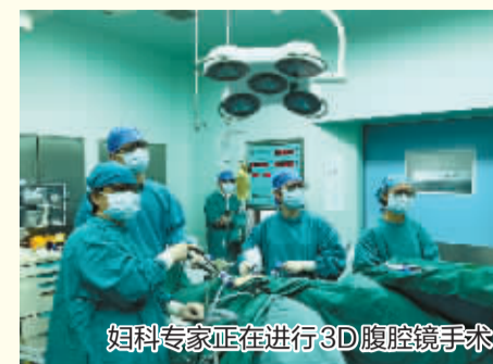
妇科专家正在进行3D腹腔镜手术