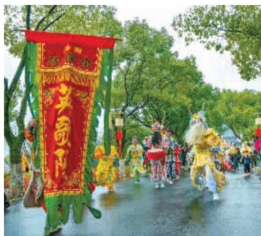
潮汕的潮,涌到了宁波。宁波的潮,很快也会涌向四面八方吧。