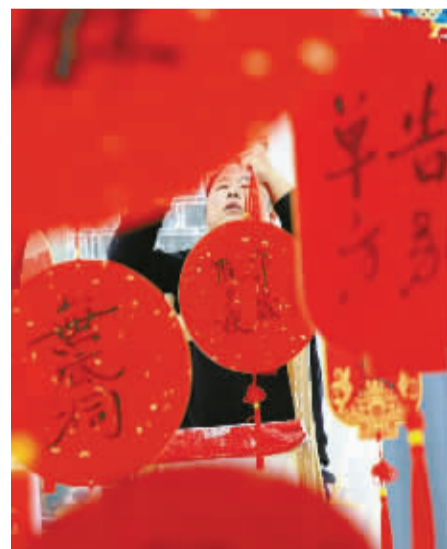
正月十五猜灯谜,多变的世界,也像一个又一个似是而非的灯谜,今天的谜面,能不能猜到明天的结局?其实没有标准答案,你坚定写下谜底时,明天已在心里。

看到一树落花,在阳光下飘摇而下。时光不会为谁留下来,但往前看,花在一茬一茬地开,未来永远值得期待。