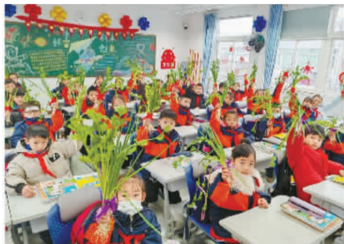
神兽归笼,寒假工程没有烂尾,于是每个小朋友都得到一份礼物——聪(葱)明勤(芹)奋,能写会算(蒜)。 用户radiance