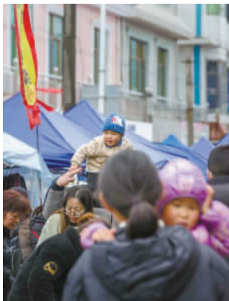
瞻岐镇大嵩古城,廿四集市持续了600多年。赶大集,赶的是市井烟火,还是童年记忆?