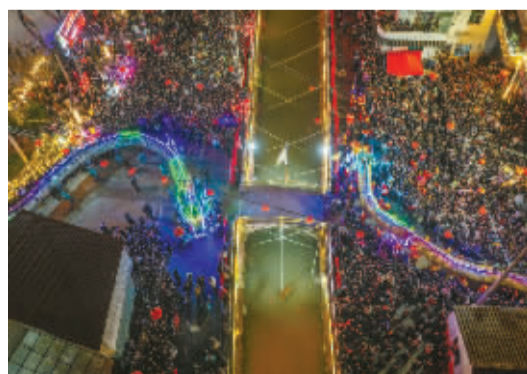
对宁海人来说,过了正月十八,看过了西岙抬龙,才算真正过了年。远行的人还没有消化完后备箱,故乡的花已开满山岗,这个春天,要加油呀。

指间流沙。指尖轻划屏幕,将那些曾留下心底涟漪的画面分享给我们的吧。因为每一个当下,都珍贵如当有意无意地随拍成为一种习惯,手机相册往往比记忆更准确地保留了生活的点滴。