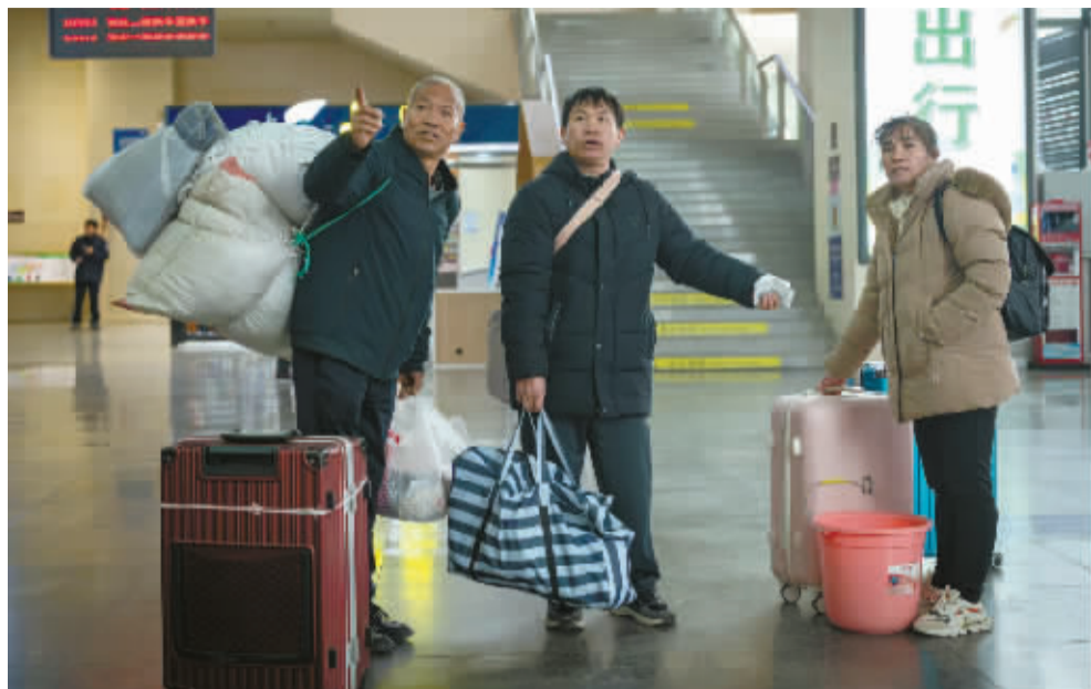
这个月,人人都在说着回家。大站有人潮,小站有小站的故事。归乡路上,人人眼里都是向往。越接近幸福的时候,就是最幸福的吧。