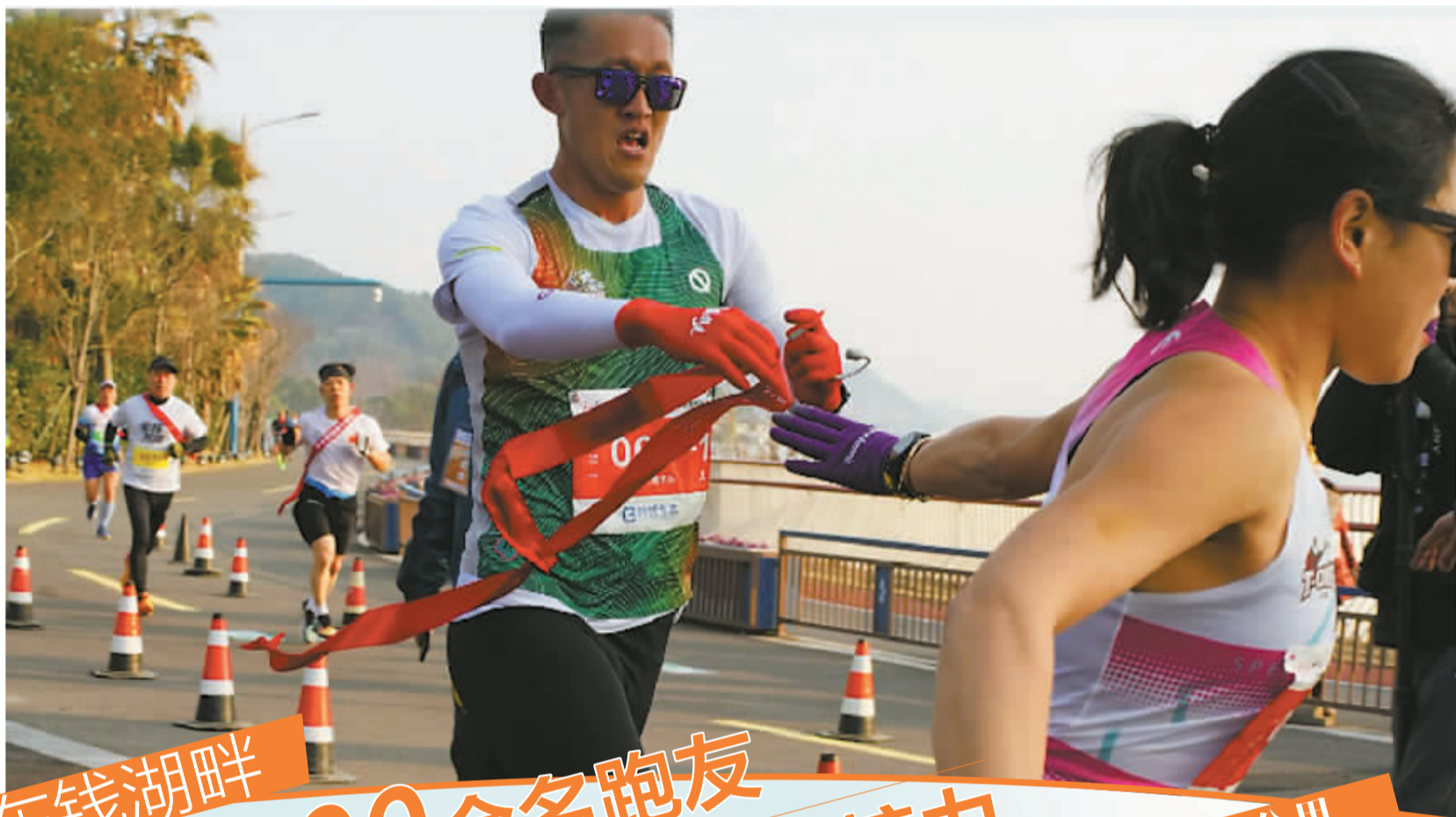
参赛队员在交接棒。