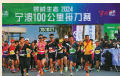
2024宁波100公里接力赛鸣枪出发。

本届比赛设置采用团队接力的方式进行，形成与传统的全马、半马赛事错位发展的模式，既满足了跑者对超长距离挑战的需求，又满足了团队协作参与的期望，得到不少跑友的追捧，共有303支队伍报名参赛，根据竞赛规程，每队5名选手参加接力跑，其中必须包括1名及以上女性选手。