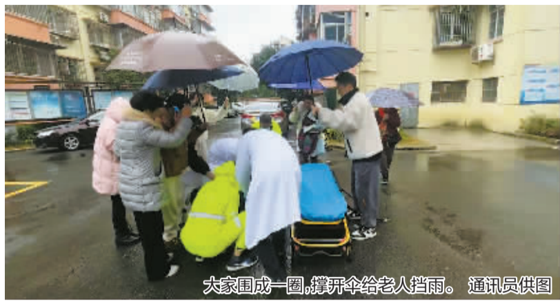
大家围成一圈,撑开伞给老人挡雨。