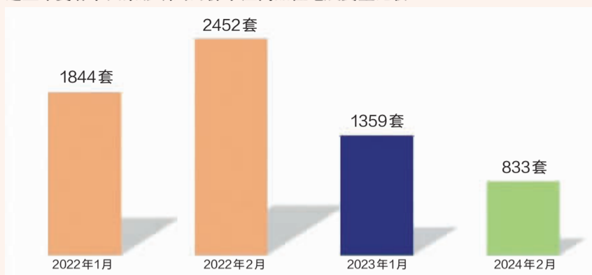
近三年受春节因素影响的月份市区商品住宅成交量比较