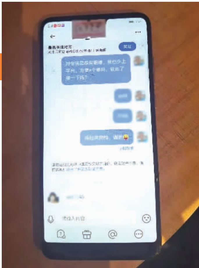
不法分子与受害人聊天截图。

北京市公安局网安总队的侦查员分析此类案件特点时表示，婚恋交友诈骗较为常见，不法分子作案套路简单，通常利用网络伪装成“金融白领”“商业精英”“军官”“公务员”等身份，骗取事主的感情和信任，接着编造各种理由骗取钱财。