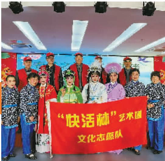
“快活林”艺术团的成员们。