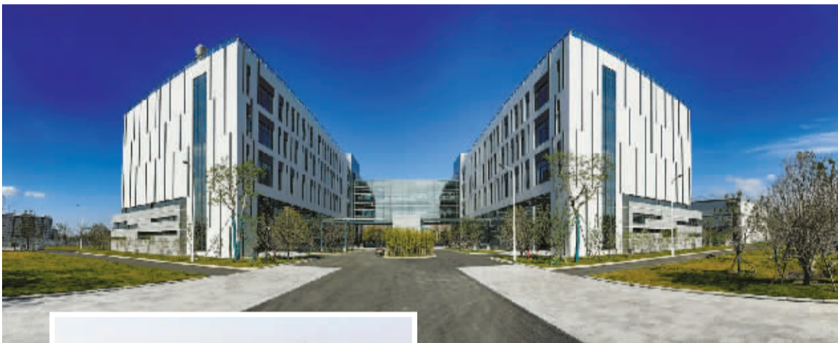
建成投入使用的中石化新材料研究院一期。