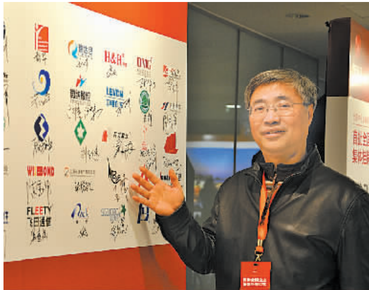
“新三板”扩容后,宁变电力成为全国首批挂牌企业。

作为专为中小企量身定制的资本市场,“新三板”究竟能给挂牌的企业带来哪些好处?“相比上市公司在另外两个市场(上证和深证)的‘浓妆艳抹’,‘新三板’的准入门槛更低,企业只要披露公开信息,‘淡妆’亮相即可。”浙商证券场外市场部总经理吕小萍表示,对管理理念、治理结构、规范意识等方面较为滞后的中小企业来说,“新三板”的“宽进严出”带来了一次重新梳理企业管理架构的机会。