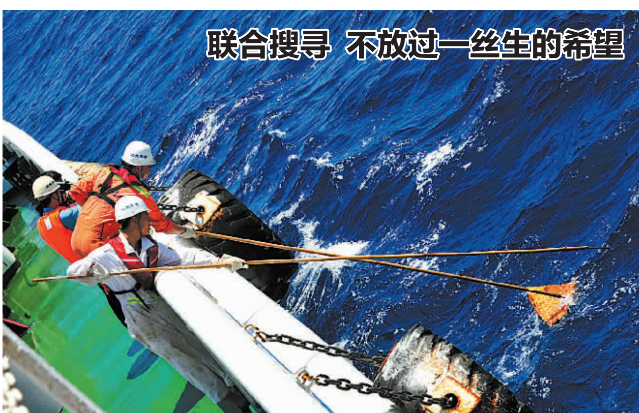
3月11日,“南海救101”船上的搜救队员在打捞可疑物品。

此外,新西兰空军一架P-3猎户座军用飞机11日将抵达马来西亚,并在马来西亚北部海域参与多国搜救行动。