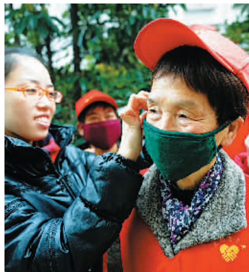
昨天，江东白鹤街道镇安社区工作人员向“一小时义工”发放专用口罩，以减少雾霾天气对健康的影响。