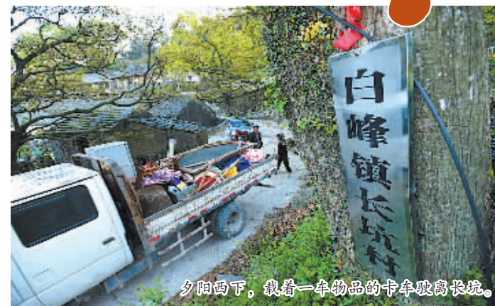
夕阳西下,载着一车物品的卡车驶离长坑。