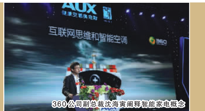
360公司副总裁沈海寅阐释智能家电概念