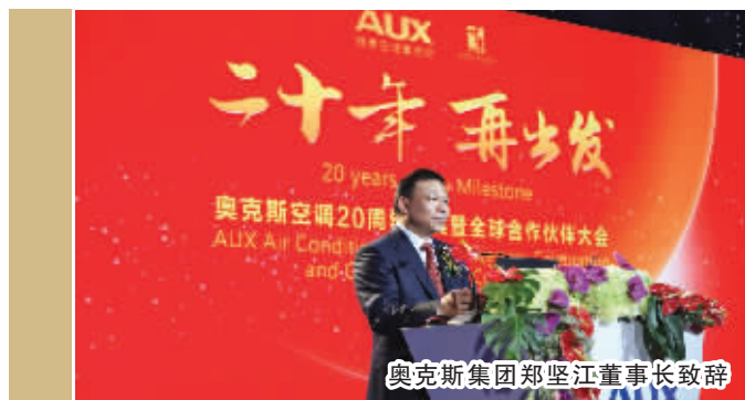
奥克斯集团董事长郑坚江董事长致辞