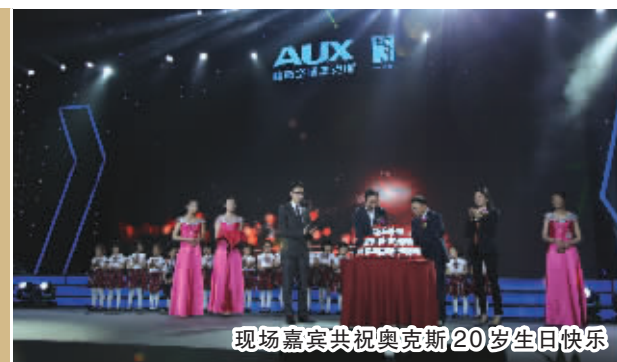
现场嘉宾共祝奥克斯20岁生日快乐