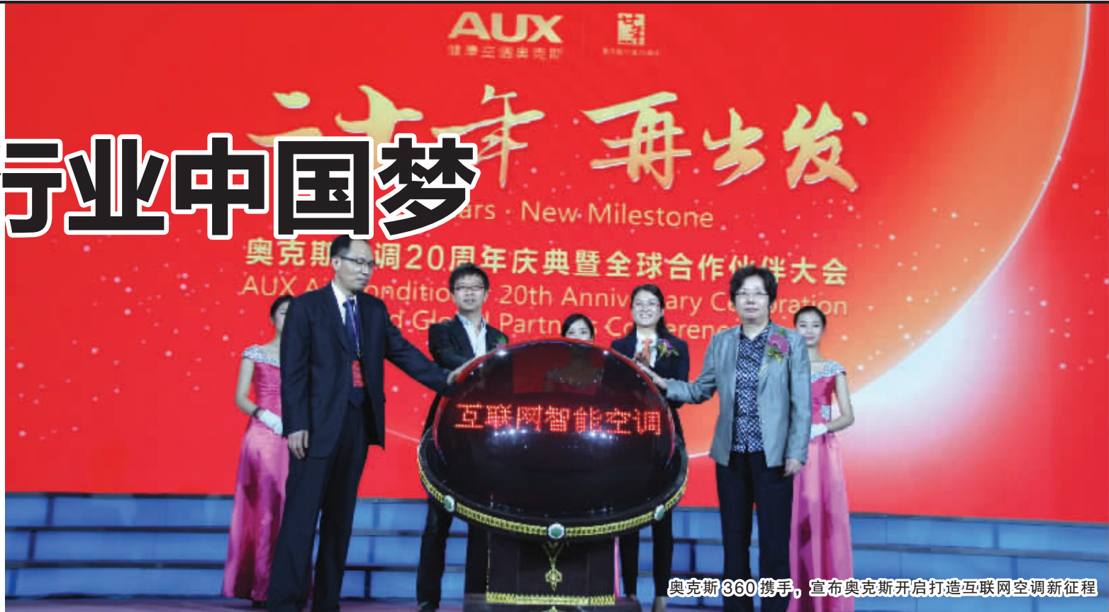
奥克斯360携手,宣布奥克斯开启打造互联网空调新征程

如果说2014年4月13日对于全体奥克斯人来说,是“最不寻常”的一天,是奥克斯空调20年来发展中浓墨重彩的一笔。随着品质驱动、转型发展的不断加快,完成20年历程总结的奥克斯空调,将站上一个自我超越的新起点。(傅婷婷)