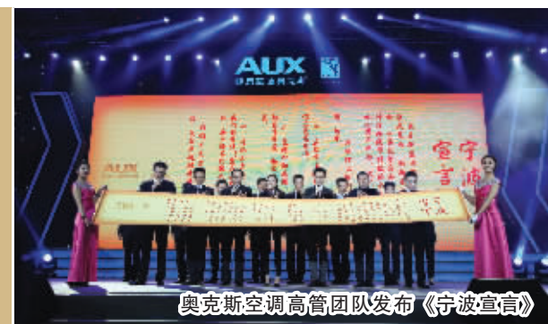
奥克斯空调高管团队发布《宁波宣言》