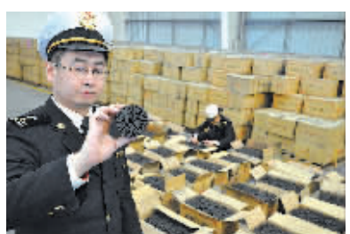
宁波海关关员正在查看走私木炭。

本报讯（俞永均 项艳群）申报品名为“枕头”、“烫衣板”等日用品的集装箱内，竟然藏着国家明令禁止出口的木炭。日前，宁波海关查获2000箱通过伪报品名走私出口的木炭，总重量24吨。 该集装箱由金华某公司从宁波口岸出口至香港，申报品名为枕头等7种小商品。经过开箱查验发现，货柜内装的是国家明令禁止出口的木炭。木炭属于国家资源类产品，烧制时需要大量树木，每烧制1吨木炭需消耗10吨左右的天然木材，同时还会产生大量有害气体，对环境造成严重污染。早在2004年，商务部、海关总署、林业局就联合发布公告，禁止出口以木材为原料直接烧制的木炭。