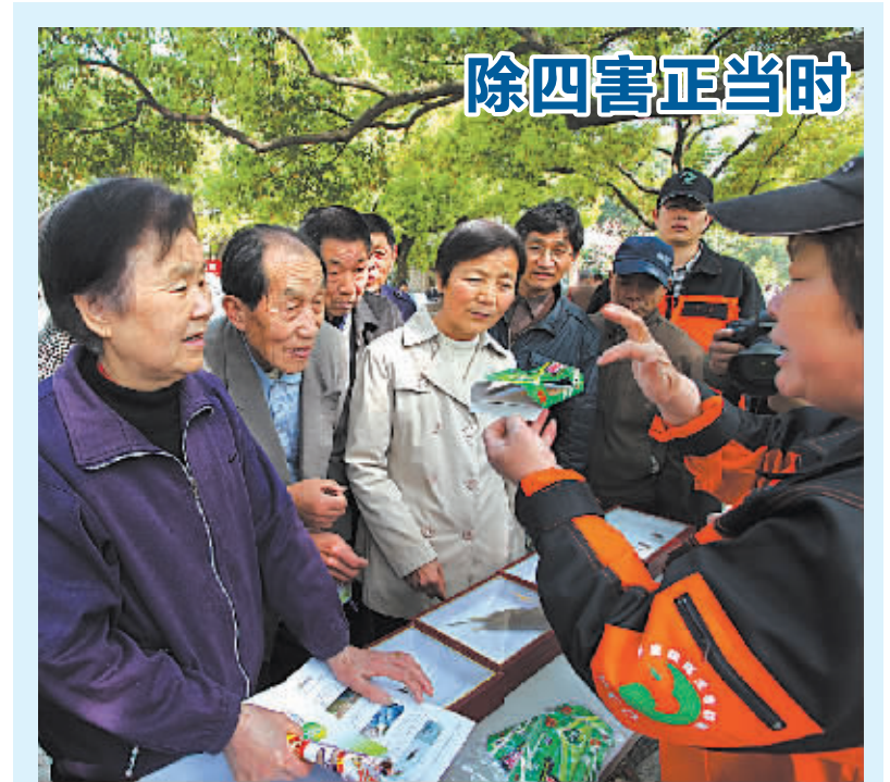
海曙区爱卫办、区疾控中心等单位日前联合在海曙公园开展“远离病媒侵害，你我共享健康”为主题的爱国卫生月宣传活动。图为宁波市鼠病媒生物防治公司工作人员在现场免费分发“蟑螂屋”，并介绍粘捕蟑螂注意事项。