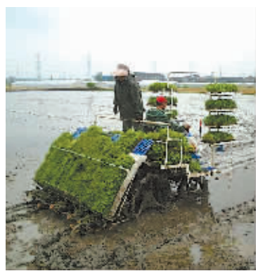
图为插秧现场。

植早稻600亩，与去年持平。 据农业部门提供的数据，今年全市早稻种植面积在24万亩左右。从农机、农业部门近期走访调查情况来看，今年无论是大田小拱棚育秧还是育秧中心大棚育秧，秧苗素质普遍较好，为完成早稻机插打下了基础，预计20日后早稻插秧将全面推开。 为顺利完成早稻机插任务，各地农机部门及早制定了春耕备耕农机化工作计划，全市组织落实各类农机具9200多台（套），其中插秧机1500多台，拖拉机3500多台，能够满足今年春耕和机插生产作业需求。全市还出动3500多台大中型拖拉机、小型拖拉机和船型拖拉机，整耕农田42万多亩，其中早稻田整耕作业已接近尾声。此外，全市已组建农机维修服务队66家，深入农村田头开展巡回维修；各农机维修网点和农机配件店储备充足，并延长了维修服务时间。