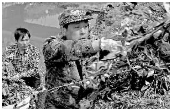
日前,宁海县力洋镇文正、前横、小青等村的300余名干部群众对流经这几个村的横直河进行整治。自去年起,力洋镇发动3万多名群众共同参与全民治水行动。目前全镇18个村排摸的40余条黑河、臭河、垃圾河已完成治理24条。

据悉,宁波实验室目前已开展了一系列科研项目,其中包括东钱湖清淤工程生态风险评估、东钱湖水生生物恢复示范工程研究、河道生态治理工程等,东钱湖生态渔业研究、东钱湖水水质监测及预警系统构建等。