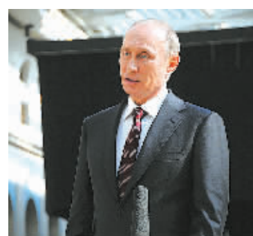
4月17日,在结束“与普京直接连线”电视节目后,普京与媒体见面。

据新华社莫斯科4月17日电(记者赵嫣)俄罗斯总统普京17日在莫斯科参加一年一度的“与普京直接连线”电视直播节目,用近4小时回答了国内民众提出的70多个问题,大多数问题与乌克兰危机有关。这是普京自2001年以来第12次参加这一节目。