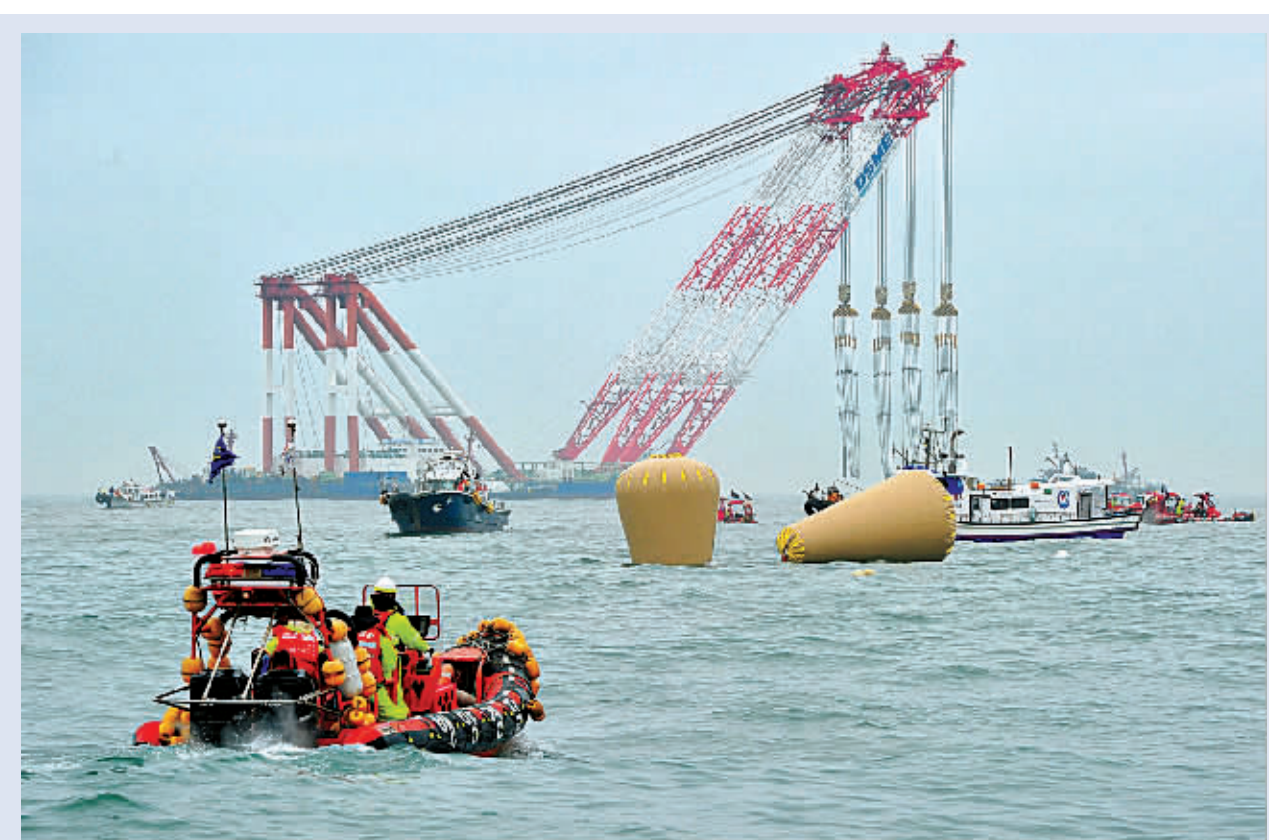
4月18日,在韩国珍岛附近海域,一架巨型海上起重机在标记“岁月”号失事客轮沉没地的浮标附近作业。

新华社供本报特稿(杜韵)尽管面临下雨、浪高、风急等不利因素,韩国搜救人员18日继续搜救“岁月”号客轮失踪人员。截至当天下午,官方确认的遇难人数上升至28人。 负责调查客轮失事原因的检察官同一天宣布,客轮下沉时,驾驶员是只有一年驾龄的三副。